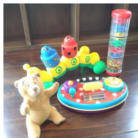
我が子が遊んだおもちゃの数々