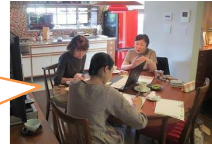
理想は左の写真のような家。

家族年表をもとに、人生の節目を考えての部屋の使い方やその期間を洗いだしたり、家族それぞれの好きな事や居場所を考えたり、今の持ち物の選別や配置場所を考えています。