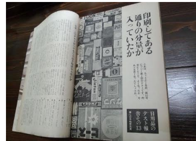
蚤の市で買った本

手離した人のおかげで60年前の本を楽しめています。好きな文章、特集、ときに滑稽で爆笑することも多々。