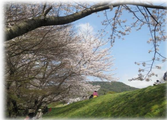
大宰府政府跡の桜

春です。いろんなことが始まりを迎える季節です。 ♪雪が解けて川になって流れゆきます♪ ♪重いコート脱いで歩きませんか♪ この季節になるといつも聞こえてくるのがこの歌です リズムがあって何か毎日が楽しい。そんな気持ちにさせてくれます。