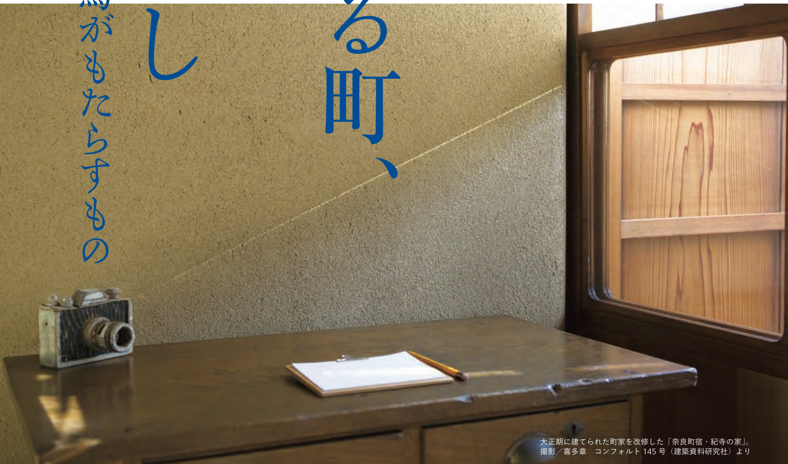
大正期に建てられた町家を改修した「奈良町宿・紀寺の家」。

つい30年くらい前まで、日本の壁といえは左官の壁だった。庶民の家もお金持ちの家も、そば屋も旅館も、学校や役所だって、左官が壁を塗っていた。それらが急速に姿を消していった。多くの左官は廃業し、後継者はいなくなっていく。はたして、左官はもう終わりなのか？日本人はもう左官を必要としていないのか？ 日本左官会議の連続シンポジウム。一緒にお考えいただけたら幸いです。