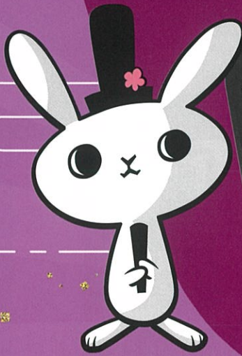
おとものタビット

大好評の「だざいふ得とく商品券」がアプリになって新登場! キャッシュレスでも30%お得なお買い物を楽しもう!