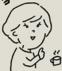
イエコトキキ (家事セラピスト)